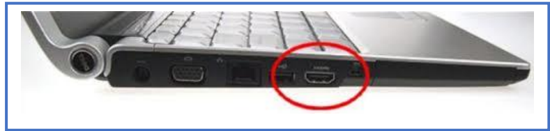
Bild 2. HDMI-port