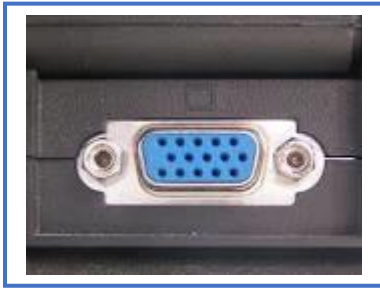
Bild 1. VGA-ingång