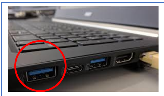
Bild 3. USB-port

Äldre datorer har ofta en VGA-ingång (bild 1), medan nyare datorer oftast har en HDMI-port (bild 2). De tunnaste bärbara datorerna har ibland bara USB-portar (bild 3). Kontrollera vilken typ av port/ingång ni har på datorn och vilken utgång som finns på skärmen. Om ni inte har en passande kabel behöver ni skaffa en. Det går också att använda en adapter om ni har en kabel med t.ex. VGA-kontakt och datorn har en HDMI- eller USB-port.